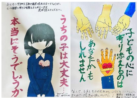
掲示用ポスター(大人向け)