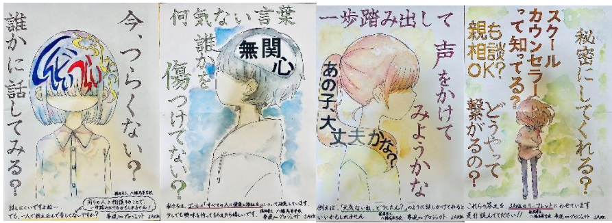
掲示用ポスター(子ども向け)